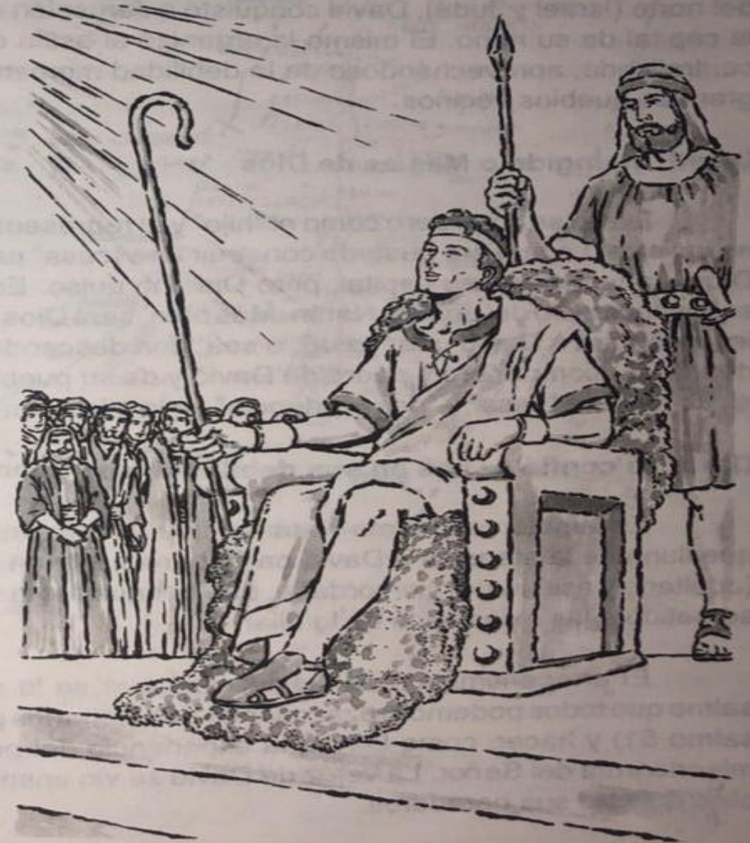
David, el rey según el corazón de Dios

una autoridad única. Esto era bastante serio, pero más para Samuel, sacerdote, juez y profeta. ¿Será Israel un pueblo como los demás? ¿Escoger un rey? ¿No será como "renegar" del Señor, que es su verdadero rey? Pero Dios mismo les dio la oportunidad de elegir su primer rey.